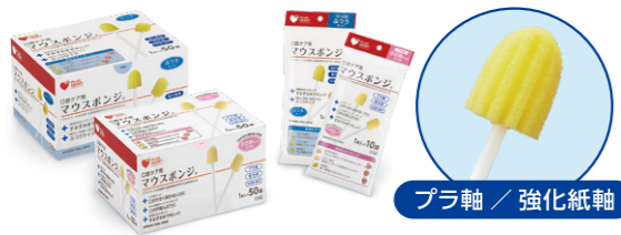
プラ軸 / 強化紙軸